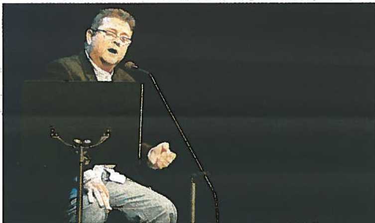
Moratalla se merecía actuar ya en el Isabel la Católica.

baile a Carminia, en una cantiga propia de este tiempo.