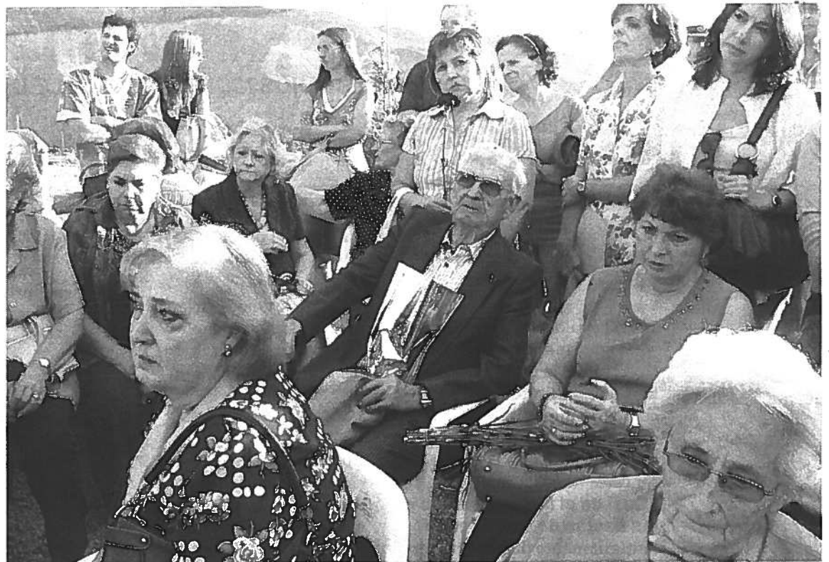
FAMILIAS. Descendientes de las víctimas depositaron flores sobre la tierra del barranco.

la amnesia forzada porque la reconciliación no es el olvido. Queda claro -afirmó- que lo que se pretende al hablar de abrir heridas es tergiversar la realidad. No se puede abrir lo que no se ha cerrado o, al menos, si se ha cerrado en falso. Sólo cuando se haga justicia se podrá hablar algún día de concordia o reconciliaciones».