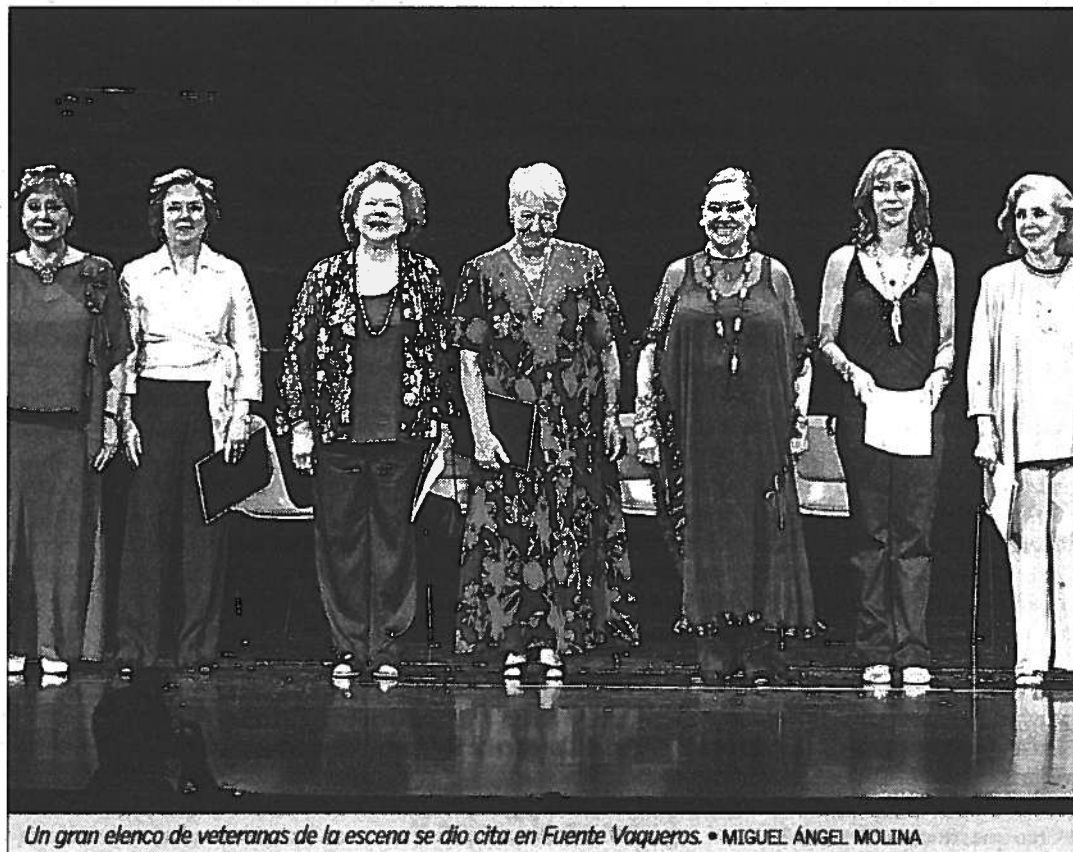
Un gran elenco de veteranas de la escena se dio cita en Fuente Vaqueros. • MIGUEL ÁNGEL MOLINA

La Diputación de Granada quiso rendir homenaje al poeta y a su casa natal a partir de una serie de eventos que tuvieron lugar a lo largo de la tarde y la no-