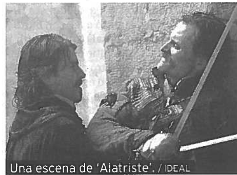
Una escena de 'Alatraste'. / IDEAL

Coincidiendo con el estreno en septiembre de la película 'Alatraste', de Agustín Díaz Yanes y protagonizada por Viggo Mortensen, el Ayuntamiento de Madrid ha organizado la exposición 'El Madrid de Alatraste. El Madrid del siglo de Oro', que tendrá lugar del 21 de agosto al 21 de octubre en el edificio de la Panadería de la plaza Mayor. El consistorio quiere celebrar así los 350 años del Plano-Guía, creado por Pedro Texeira, el cual adentra en el Madrid de mediados del siglo XVI. / EFE