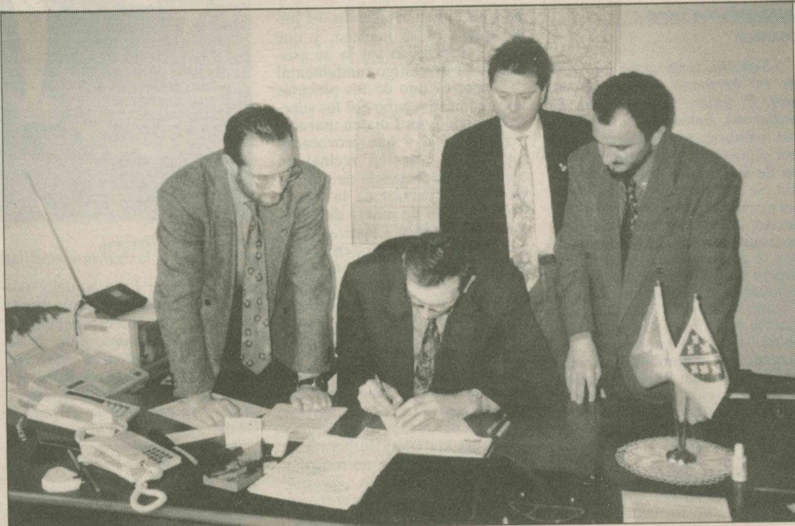
Momento de la firma del convenio en el Consulado de Bosnia-Herzegovina en Estambul (Turquía).

Quienes se encuentren en condiciones más perentorias serán trasladados a Granada para ser sometidos a operaciones imposibles de realizar en Estambul. Bosnia-Herzegovina correrá, por su parte, con los gastos que se