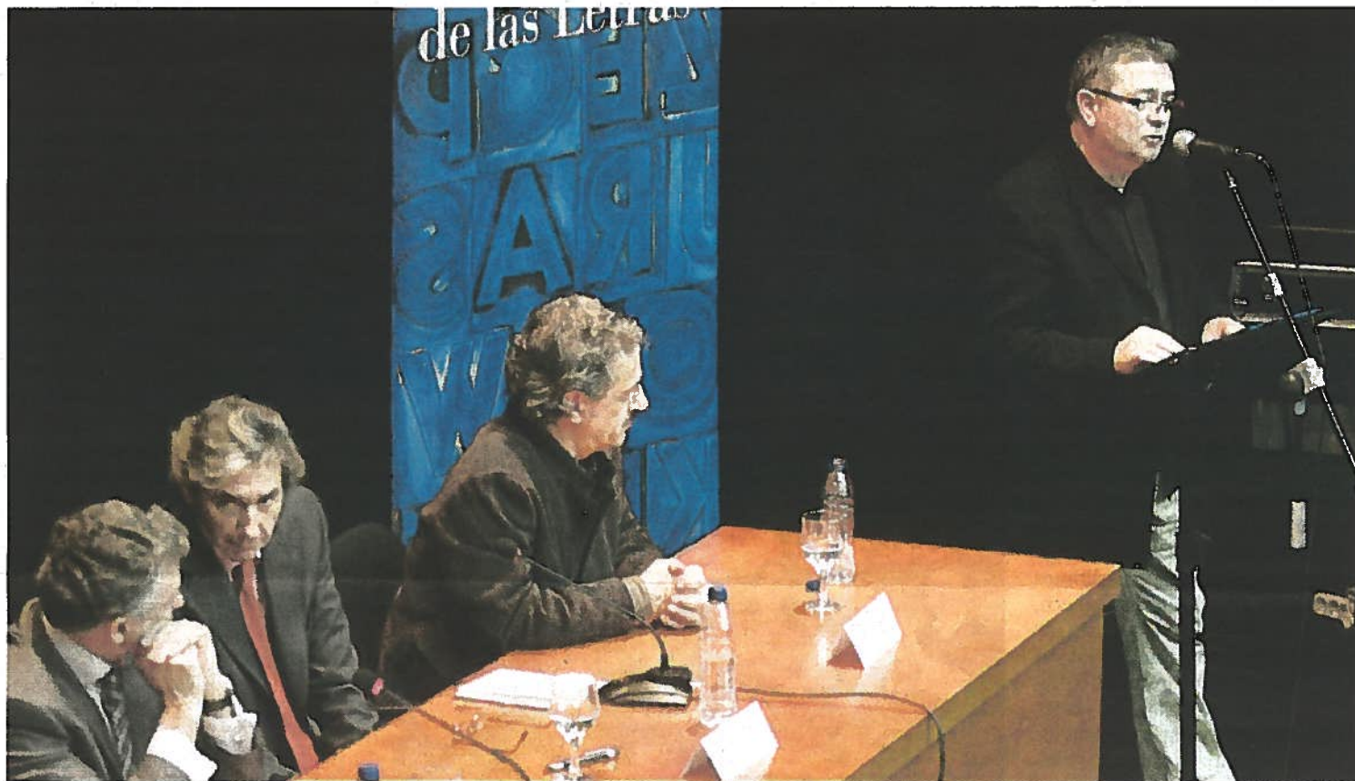
Distintas personalidades de la cultura de la ciudad leyeron versos de Rosales.

"Es difícil no tener amor a los libros, no sólo porque pueden ser nuestros mejores amigos, sino porque también son nuestros acompañantes continuos que nos ofrecen entretenimiento, nos enseñan a buscar la sabiduría además de ser el medio más apropiado para avanzar por el camino hacia la libertad y el en-