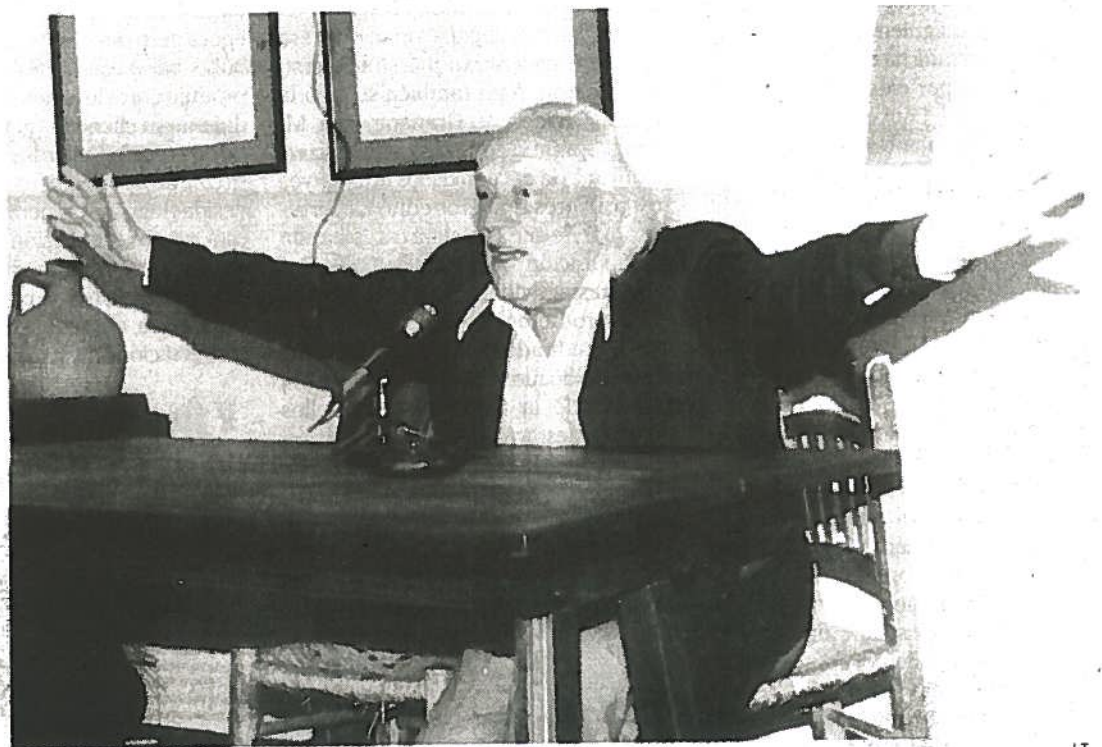
➔ En aquella noche de poesía con Rafael Alberti generó la idea de que todo podía ocurrir en La Tertulia.