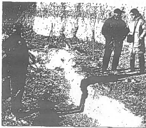
EXCAVACIONES. Trabajos arqueológicos en Orce.

El municipio de Orce quedará este año en un segundo plano respecto a las excavaciones financiadas por la Junta, lo que no significa que cesen los trabajos de investigación, que serán más intensos este verano. Los trabajos que comenzó hace cuatro años el Instituto de Sabadell en Barranco León y Fuente Nueva finalizan este año, por lo que está previsto que se dedique esta quinta campaña al estudio de las miles de piezas halladas durante las excavaciones de los últimos años. La única opción de que haya excavaciones este año en Orce es el yacimiento de Venta Micena, el lugar donde Josep Gibert encontró el polémico resto del hombre de Orce. Después de varios años en los que esta zona se ha quedado fuera de las prospecciones, la Junta autorizó los trabajos allí el verano pasado y este año está aún en el aire.