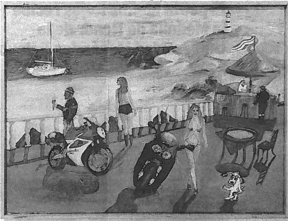
Paisaje de una playa de tintes 'naïf' firmado por uno de los reclusos.