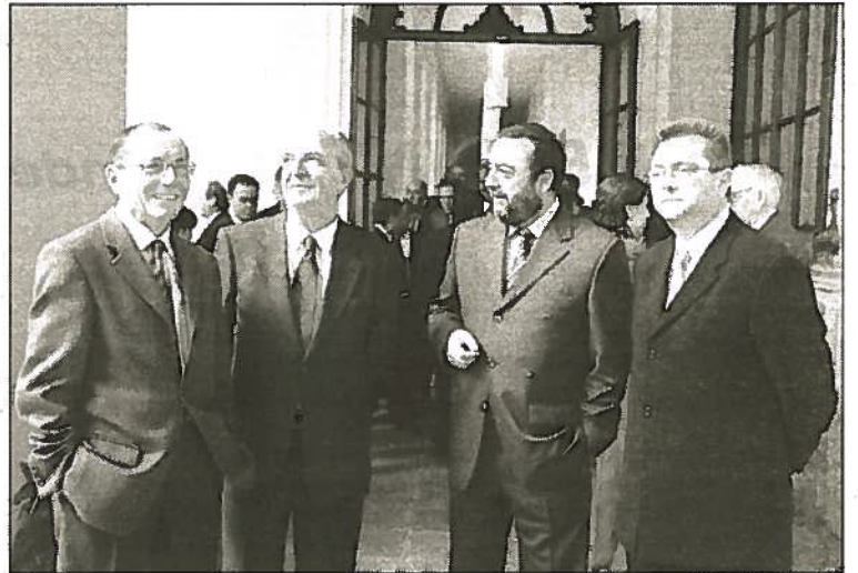
Los cuatro nuevos consejeros de la Junta, ayer en el Palacio de San Telmo.

excusa. En un discurso a los recién llegados, recalcó que éste no es, como «por error» pueda entenderse, un «gobierno en funciones», sino «en plenitud de funciones hasta el 14-M». «Ni la precampaña ni la campaña electoral pueden ni deben interrumpir la gestión política que debe llevarse a cabo», proclamó.