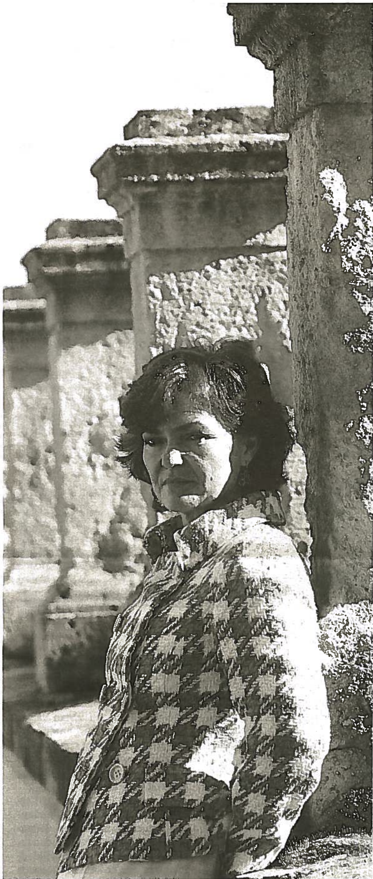
CULTURA. La cordobesa Carmen Calvo será la responsable del ministerio.

Cultura. Que haya o no impulso a las infraestructuras de la provincia puede elevar o hundir al PSOE granadino tras la apuesta que ha hecho en campaña. Chaves pidió colaboración al Gobierno y ahora Calvo tendrá que responder