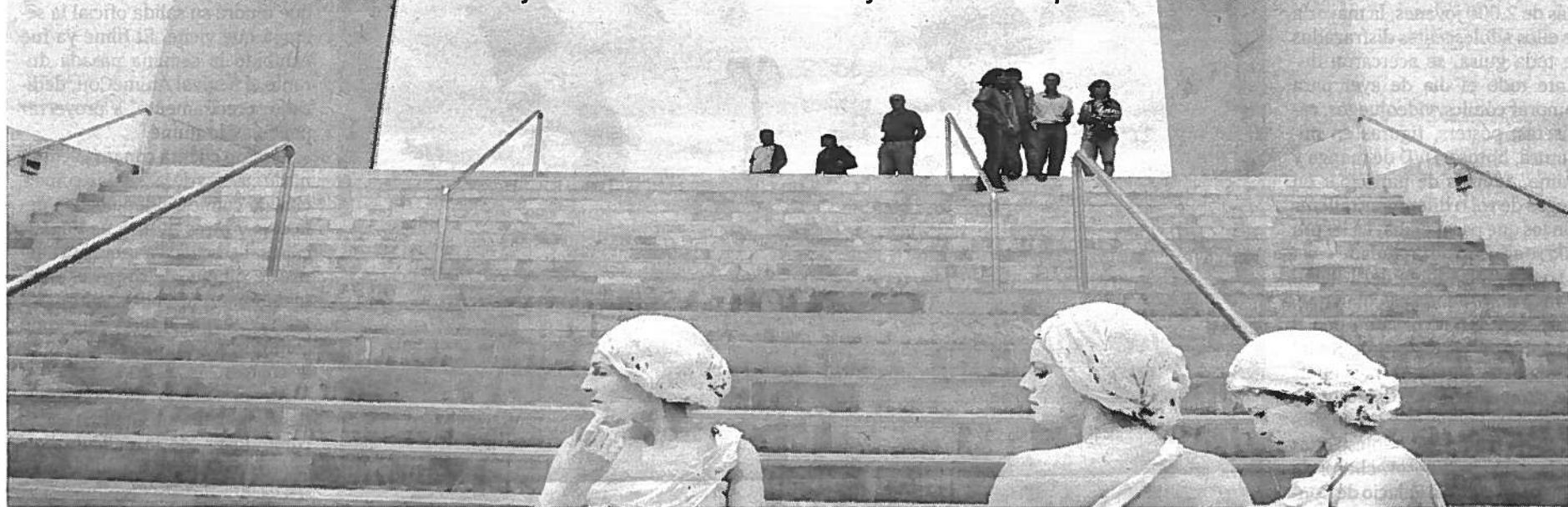
REPORTAJE: MIGUEL RODRÍGUEZ

El Centro Cultural de CajaGranada celebra sus jornadas de puertas abiertas