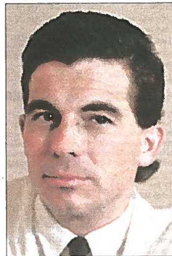
Alberto Campo Baeza.

R. Es una arquitectura de nuestro tiempo, moderna. Los materiales y la tecnología son