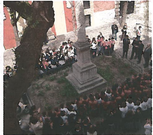
Concentración con motivo del Día del Teatro.