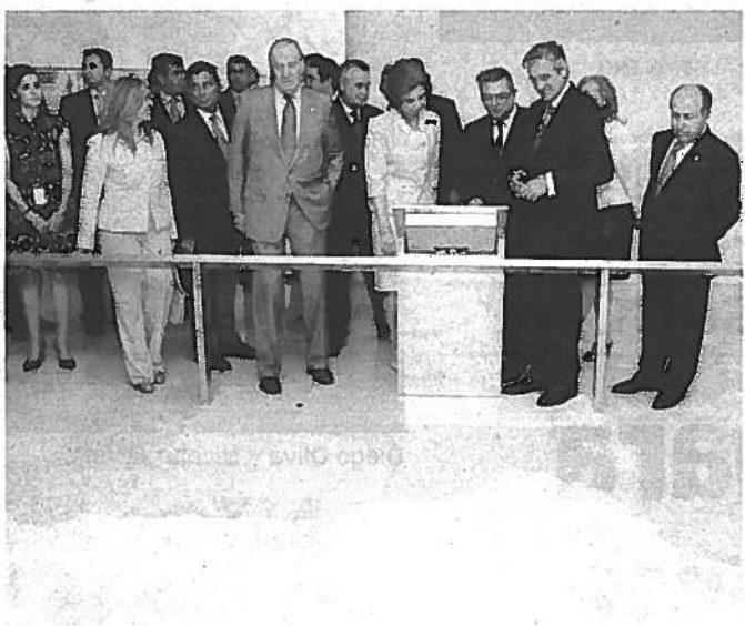
UN MAPA. Recibieron las explicaciones de los anfitriones