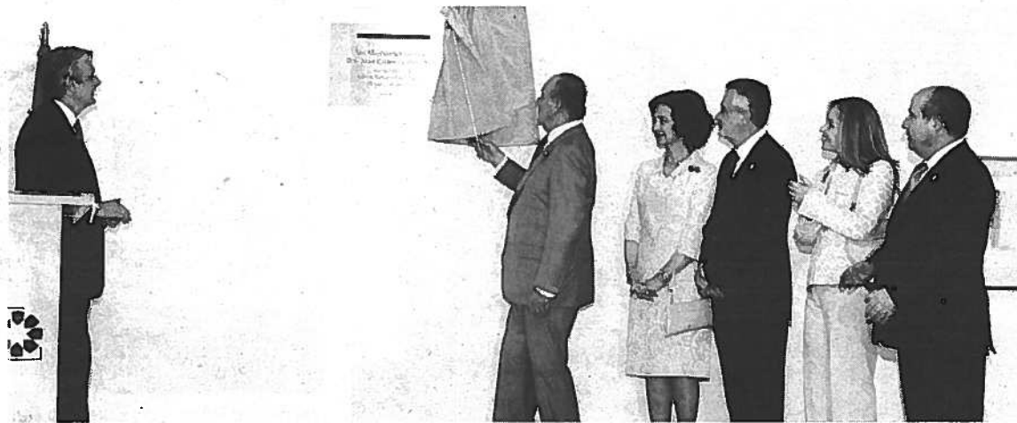
LA PLACA fue descubierta en la sala de exposiciones temporales ante 350 invitados.