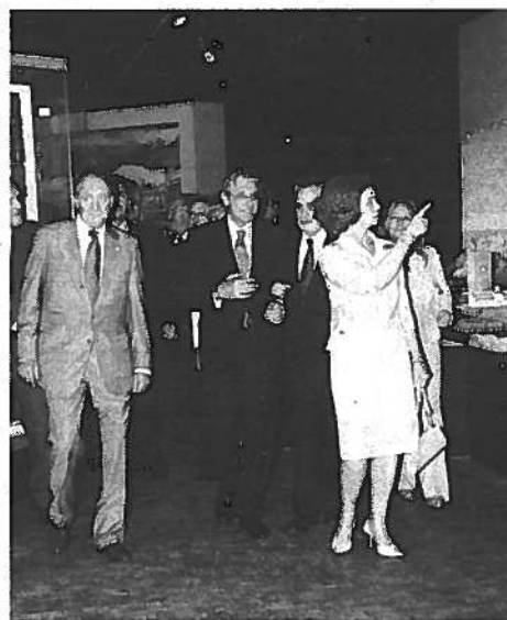
EL MUSEO les despertó curiosidad.

seo que albergará la memoria de nuestra tierra y de sus gentes, que es la historia de una parte esencial de España.