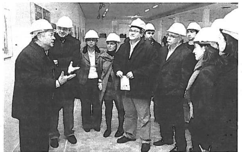
PP. Moratalla da cuenta de las instalaciones a sus cargos. / G. M.