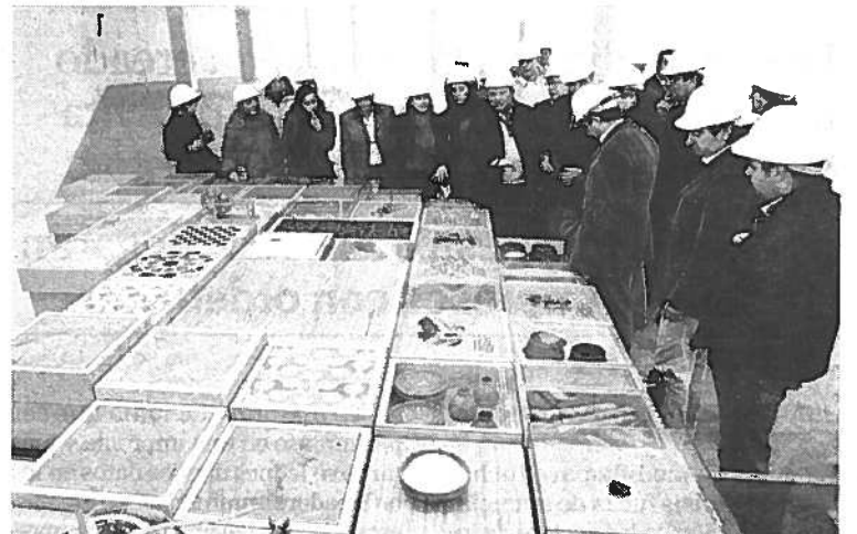
EXPOSICIONES. Elementos que se utilizarán en una de ellas. / G. M.