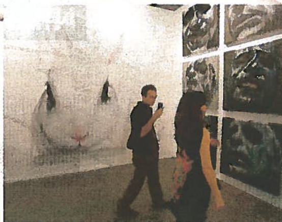
Dos visitantes pasan junto a las obras de Ydáñez.