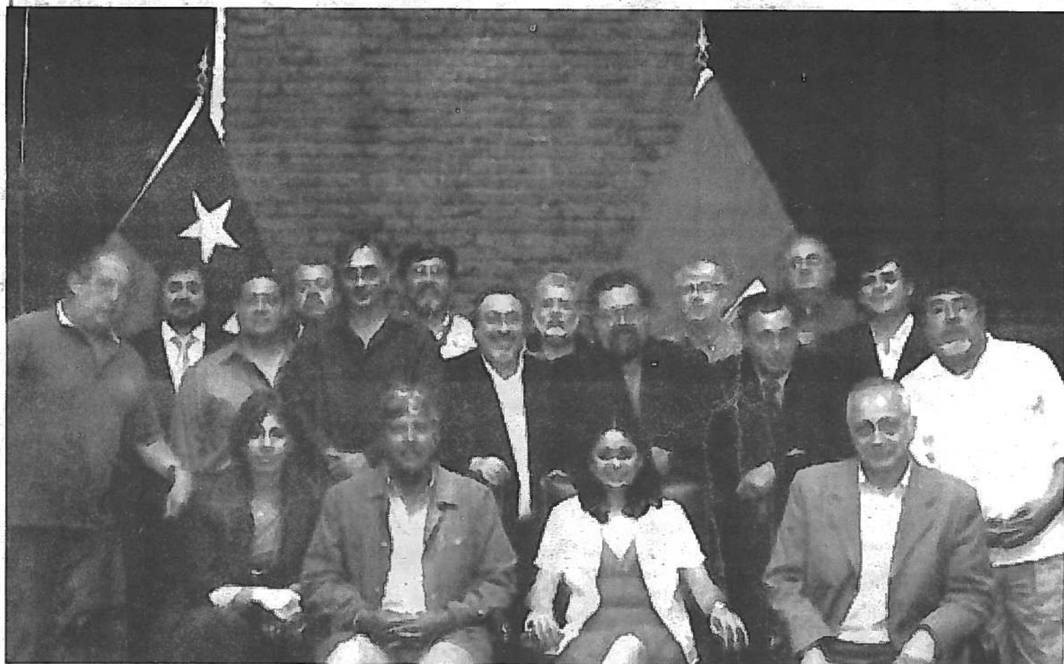
Representantes políticos de la mayoría de las ciudades participantes, en la reunión que se llevó a cabo en el Salón de Plenos de la Ilustre Municipalidad de Valparaíso